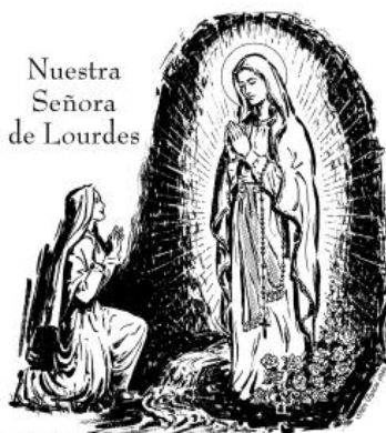
Nuestra Señora de Lourdes

Alumbre así vuestra luz a los hombres, para que vean vuestras buenas obras, y den gloria a vuestro Padre que está en el cielo.