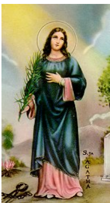
Saint Agatha Feast day February 5

Simeon had been promised by the Holy Spirit that he would see Christ the Lord, the Messiah, before he died. The holy man immediately recognized the infant Jesus as the promised Savior, a "light for revelation to the Gentiles, and glory for your people Israel." Anna also recognized Jesus as the fulfillment of the promise of redemption and spoke about him to all.