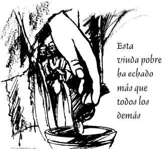
Esta viuda pobre ha echado más que todos los demás