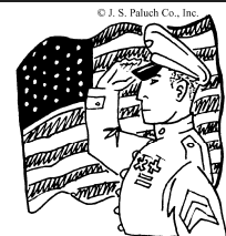
Día de los veteranos

Les pedimos que mantengan en sus oraciones a todos los veteranos vivos y fallecidos, al igual que a todas las familias de estos héroes de la nación.