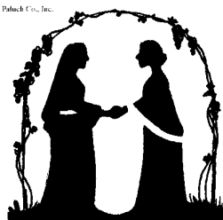
Visitation of the Blessed Virgin Mary

derstood as the beginning of the Church. Jesus commissions his disciples to continue to teach in his name and to bring others into the community of disciples through baptism. The Gospel ends, as it had begun, with the promise that Jesus will continue to be Emmanuel, "God with us" (cf. Matthew 1:23), for all eternity.