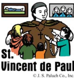
Saint Vincent de Paul, 1581-1660 September 27

St. Vincent de Paul spent the early years of his priesthood ministering among the wealthy in the French countryside near Paris. In 1609 he became tutor to the children of the Gondi family, an involvement that taught him a principle for his work: evangelize the rich and direct them to serve the poor. At that time, Vincent observed that many poorly catechized peasants were not making good confessions.