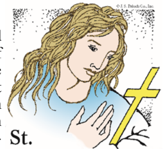
St. Mary Magdalene

Matthew, Mark, and John record that Mary of Magdala was present at the crucifixion of Jesus and that she was among the women who visited the tomb on Easter morning. Luke mentions her presence only at the tomb on Easter. According to John, Mary was specially privileged to see and speak to the risen Lord on Easter morning. She thought he was the gardener until he said her name.