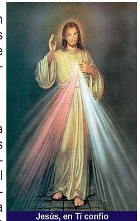
Jesús, en Tí confío

Se concede la indulgencia plenaria, con las condiciones habituales (confesión sacramental, comunión eucarística y oración por las intenciones del Sumo Pontífice) al fiel que, en el domingo segundo de Pascua, llamado de la Misericordia divina, en cualquier iglesia u oratorio, con espíritu totalmente alejado del afecto a todo pecado, incluso venial, participe en actos de piedad realizados en honor de la Misericordia divina, o al menos rece, en presencia del santísimo sacramento de la Eucaristía, públicamente expuesto o conservado en el Sagrario, el Padrenuestro y el Credo, añadiendo una invocación piadosa al Señor Jesús misericordioso (por ejemplo, "Jesús misericordioso, confío en ti").