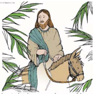
Blessed is he who comes in the name of the Lord.