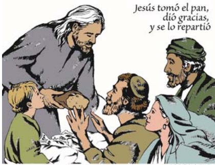
Jesús tomó el pan, dió gracias, y se lo repartió