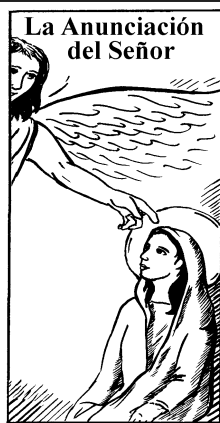
La Anunciación del Señor