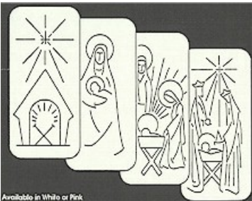
Available in White or Pink

Oplatki, meaning "holy bread" are thin sheets of wafer embossed with figures of the Christ Child or other Christmas scenes.