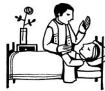
Anointing of the sick.

Before the renewal of church practices after the Second Vatican Council anointing prayers for the sick were only offered to those near death. We named the sacrament EXTREME UNCTION , the final anointing.