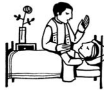
Anointing of the sick.

Before the renewal of church practices after the Second Vatican Council anointing prayers for the sick were only offered to those near death. We named the sacrament EXTREME UNCTION , the final anointing.