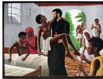
St. Peter Claver Feastday: September 9th