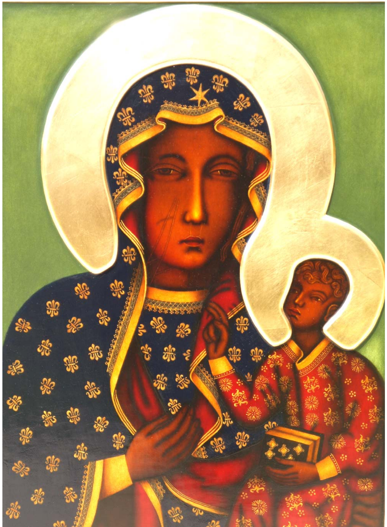
Feast of Our Lady of Czestochowa August 21, 2011