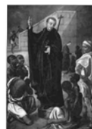
St. Peter Claver Feastday: September 9th

Lord God, I thank you today for the gift of my life, and for the lives of all my brothers and sisters. I know there is nothing that destroys more life than abortion, Yet I rejoice that you have conquered death by the Resurrection of Your Son. I am ready to do my part in ending abortion. Today I commit myself Never to be silent, Never to be passive, Never to be forgetful of the unborn. I commit myself to be active in the pro-life movement, and never to stop defending life Until all my brothers and sisters are protected, and our nation once again becomes a nation with liberty and justice not just for some, but for all, Through Christ our Lord. Amen!