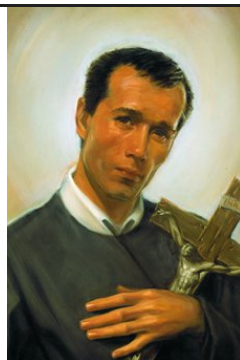
San Gerardo Mayela Redentorista C.Ss.R. 16 de Octubre