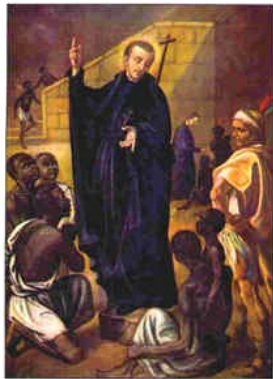
St. Peter Claver Feastday: September 9th