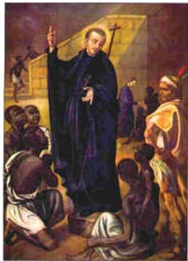
St. Peter Claver Feastday: September 9th