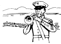
Memorial Day

Very often we forget what Memorial Day really means, and very rarely do we ask ourselves why we celebrate Memorial Day. Those who have served in the armed forces or have family members who have done so are well aware of the history and meaning of Memorial Day, some painfully so.