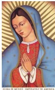
REINA DE MEXICO EMPERATRIZ DE AMERICA