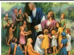
Dice Jesús: "Dejad que los niños vengan a mí" (Lucas 18, 16)