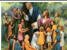
Dice Jesús: "Dejad que los niños vengan a mí" (Lucas 18, 16)