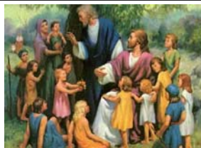
Dice Jesús: "Dejad que los niños vengan a mí" (Lucas 18, 16)