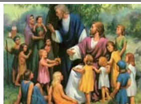
Dice Jesús: "Dejad que los niños vengan a mí" (Lucas 18, 16)