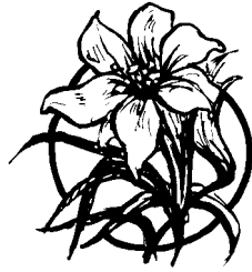
© J. S. Paluch Co., Inc.

The priests and staff of St. Mary of Czestochowa Parish wish all of you and your families a very Happy and Blessed Easter!